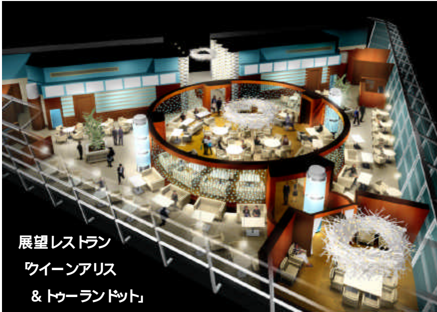
展望レストラン ウイーンアリス & トゥーランドット