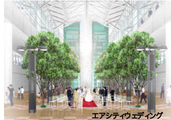
エアシティウエディング

飛行機を間近で眺めながら本格的な食事ができる展望レストランや、個性豊かなお店が並ぶ ちょうちん横丁・レンガ通り。国際空港ならではの免税店はもちろん、屋内ガーデンでの エアシティウエディングや展望風呂など、魅力ある施設が満載です。 スカイタウンは飛行機を利用される方はもちろん、お見送りやお出迎えなど、飛行機を利用されない方 にも満足していただけます。